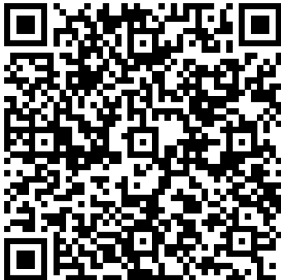
QR-code informatiepagina Kwaku